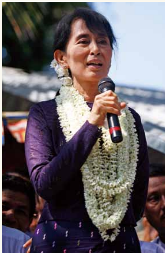
❶ 長期以來， 翁山蘇姬 為爭取 緬甸 自由平等不遺餘力，經常來往各地發表演說、激勵人心。

雖然失去父親的傷痛猶在，她與家人卻從未忘記父親的理想。直到 15 歲那年，母親擔任 緬甸 駐 印度 大使，她跟隨母親到 印度 ，接觸 印度 聖雄 甘地 的思想，被 甘地 領導 印度 民眾以和平的不合作運動抵制 英國 統治的做法深深感動。