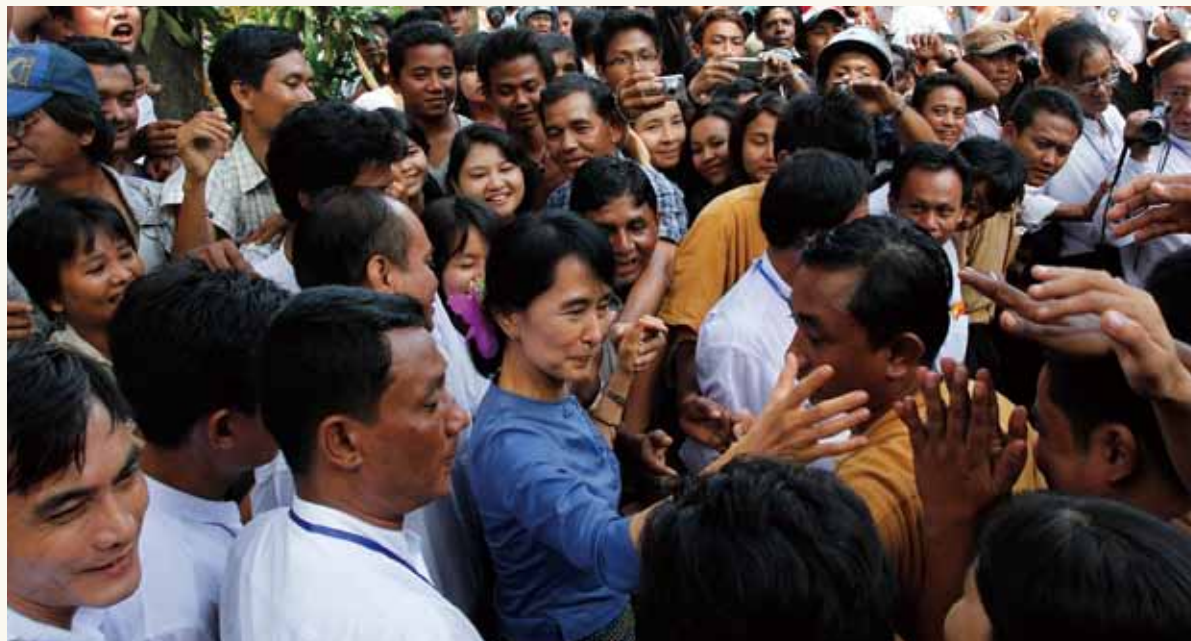
② 翁山蘇姬所到之處總是人潮洶湧，那是因為人們感謝她無私的作為與無懼的勇氣。

儘管翁山蘇姬已被軟禁，但在國際輿論的壓力下，1990年軍政府不得不舉行國民代表大會大選，翁山蘇姬領導的「全國民主聯盟」獲得壓倒性的勝利。正當大家以為翁山蘇姬即將被釋放、成為緬甸總理的時候，軍方卻判定「全國民主聯盟」是非法團體，片面地宣布選舉無效。