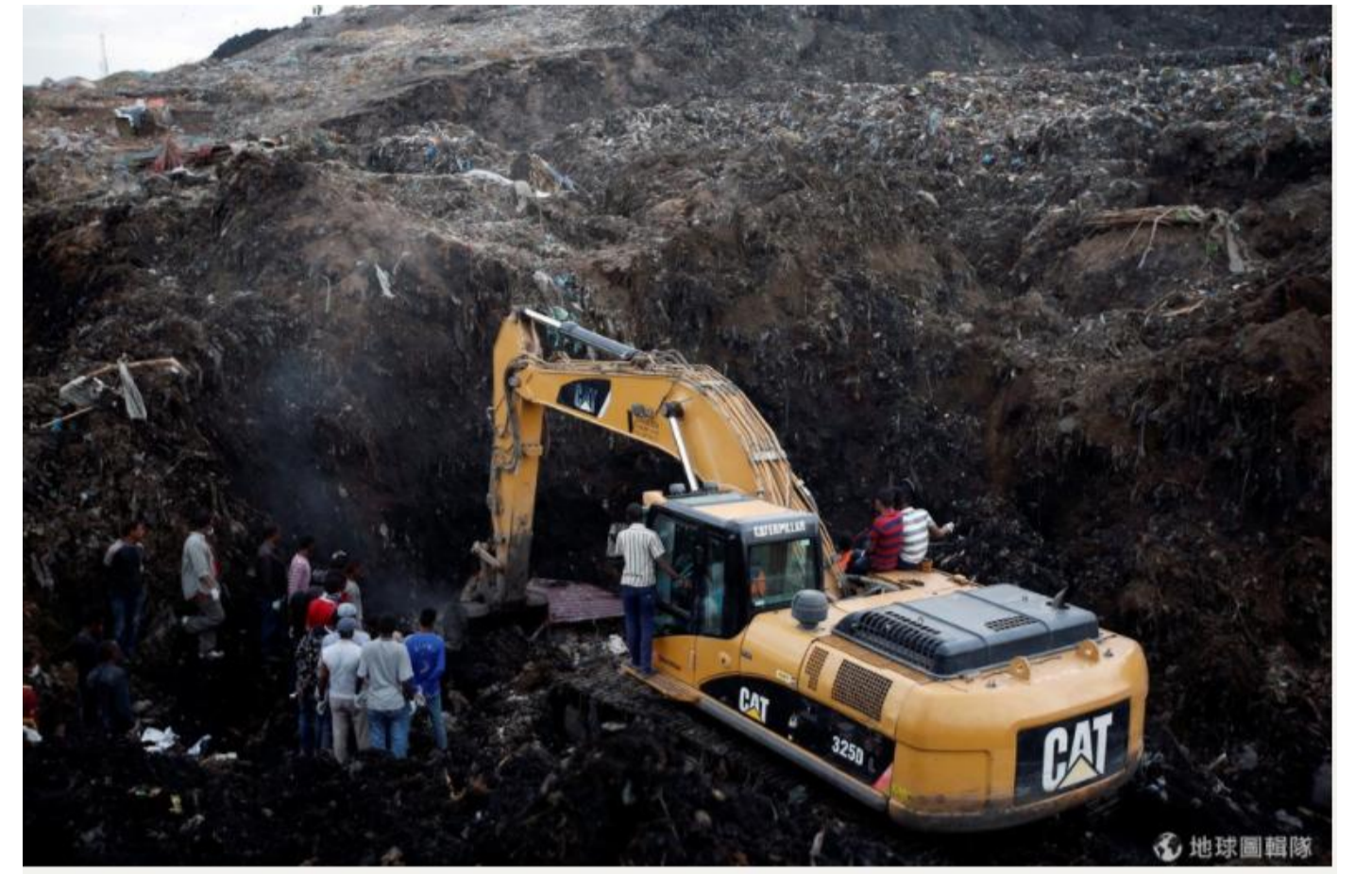
圖為2017年3月，Koshe垃圾山崩塌後，搜救隊出動推土機清除倒塌的垃圾尋找生還者。

事實上，在瑞比垃圾發電廠完工以前，這裡原本是一座佔地約36個足球場面積的垃圾山「Koshe」，意為「灰塵」。這座Koshe垃圾山在當地至少至少有40年之久，是阿-迪-斯-阿-貝-巴最主要之垃圾收集場。