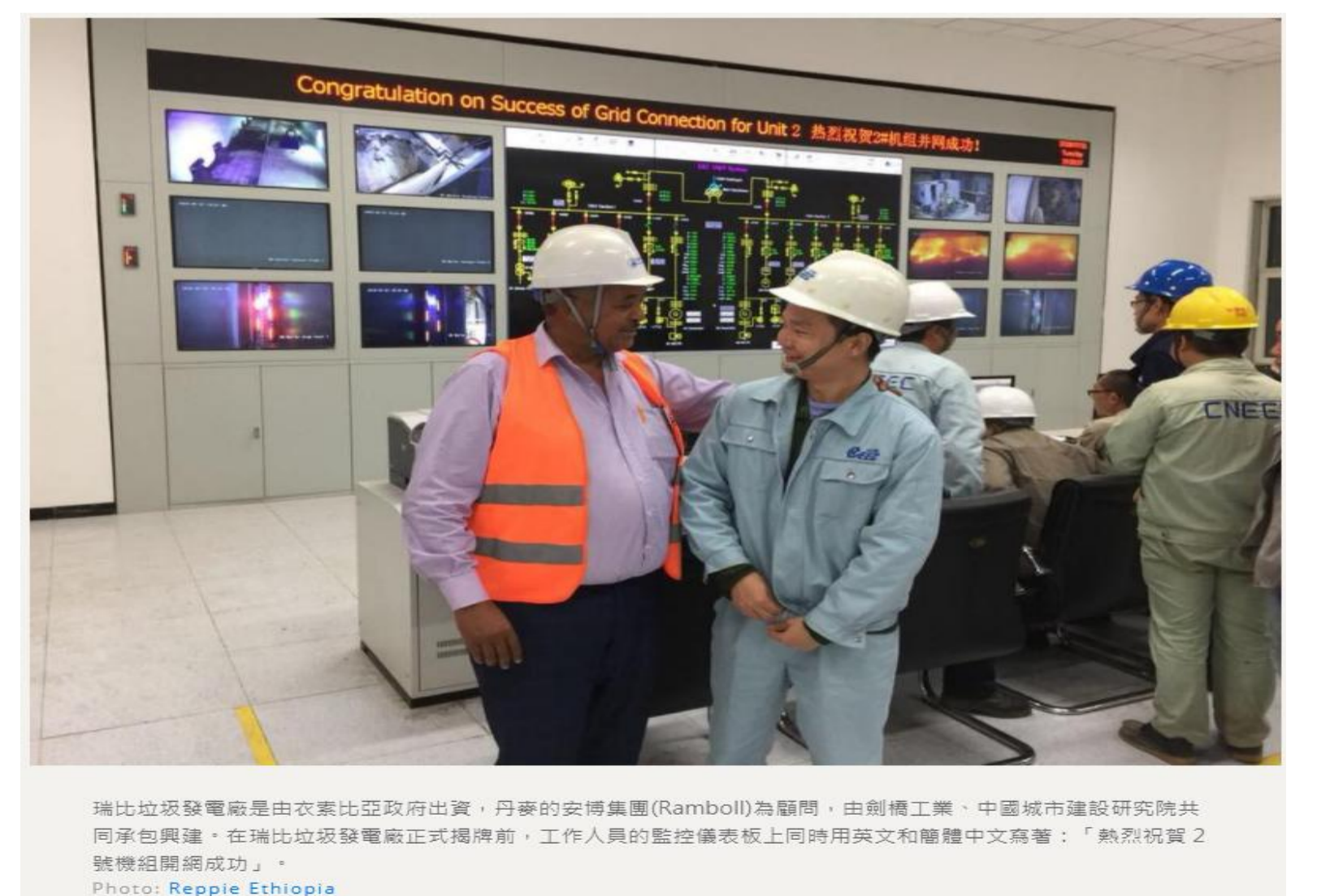
瑞比垃圾發電廠是由衣索比亞政府出資，丹麥的安博集團(Ramboll)為顧問，由前機工業、中國城市建設研究院共同籌建。在瑞比垃圾發電廠正式揭牌前，工作人員的監控儀表板上同時用英文和體體中文寫著：「熱啟發2號機組開機成功！」

而衣-索-比-亞駐聯合國代表格-塔-丘(Zerubabel Getachew)則說：「我們希望瑞比能成為這個地區，以及世界上其他國家的典範。」